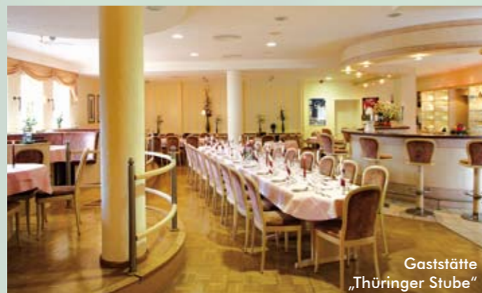
Gaststätte „Thüringer Stube“

Neben unserem Speiserestaurant für ca. 135 Personen, bietet auch unsere Lobby und „Thüringer Stube“ Gelegenheit für einen angenehmen Aufenthalt (alle rauchfrei). Zwei große Gartenterrassen mit Blick über unsere Parkanlage und zum Inselsberg laden an Sommertagen zum Verweilen ein. Nach einem reichhaltigen Frühstücksbuffet in angenehmer Atmosphäre wünschen wir Ihnen einen schönen und abwechslungsreichen Tag.