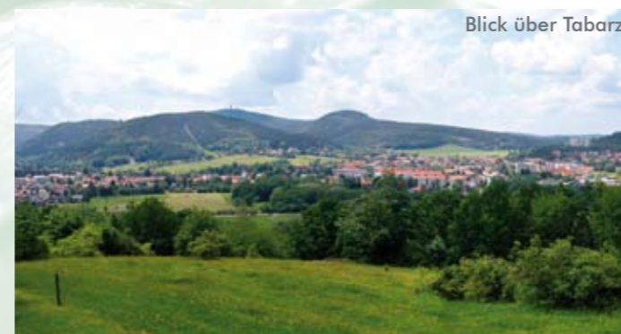
Blick über Tabarz

Tabarz ist ein alter traditionsreicher Ort, zentral gelegen, so dass die zahlreichen umliegenden Sehenswürdigkeiten schnell und einfach zu erreichen sind.