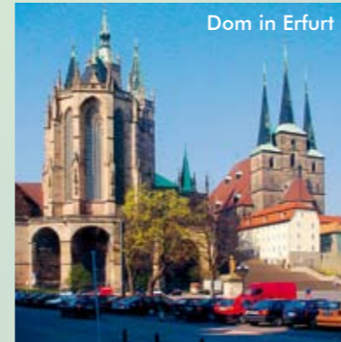
Dom in Erfurt

Im verschneiten Winter finden Sie in der Nähe gespurte Loipen, Sessellift am Datenberg und Schlepplift am Großen Inselsberg.