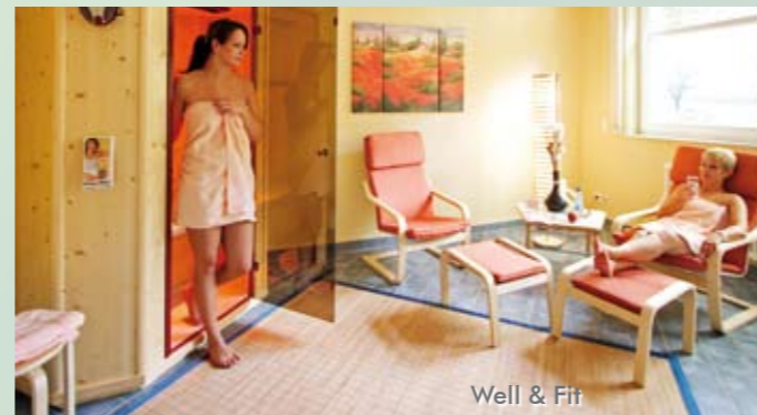
Well & Fit

Unser Hotel bietet Ihnen eine angenehme Atmosphäre und 3-Sterne-Superior-Komfort.